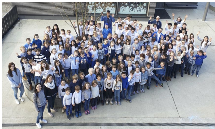
Blauweisstag im Ägerten

Es freut uns zu sehen und zu hören, wie gross die Euphorie unter den Schülerinnen und Schüler bezüglich dem SuS-Rat ist. Der wollen wir gerne nachkommen, weshalb ab nächstem Schuljahr die Räte vier Mal jährlich tagen werden.