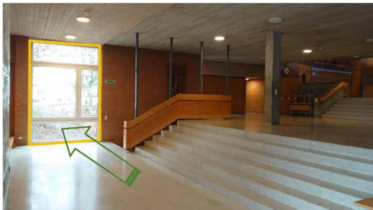
Neuer Fluchtausgang Obergeschoss Mettlen 2 direkt ins Freie.