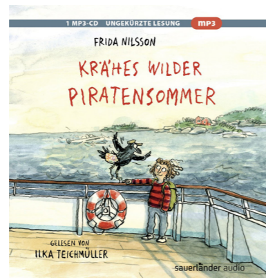
Krähes wilder Piratensommer: ab 7 Jahren