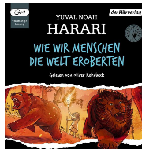
Wie wir Menschen die Welt eroberten: ab 10 Jahren