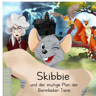
Skibbie und der mutige Plan der Barmbeker Tiere: ab 6 Jahren